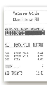
Ventes par article